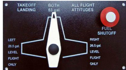
Exemple de sélecteur carburant

Je viens à nouveau de constater une utilisation non conforme de ce sélecteur. Je vous rappelle donc ses règles principales d'utilisation.